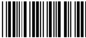
トリガ無し(常時点灯)

LED の点灯時間を設定する場合に使用します。デフォルトは3秒に設定してあります。設定は右のバーコードを読み込みした後、「16 進一覧表」のテーブルを読み込んで時間を設定します。