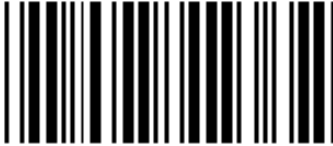
トリガスイッチにて ON/OFF