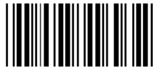
トリガ ON してからの光線の OFF 時間